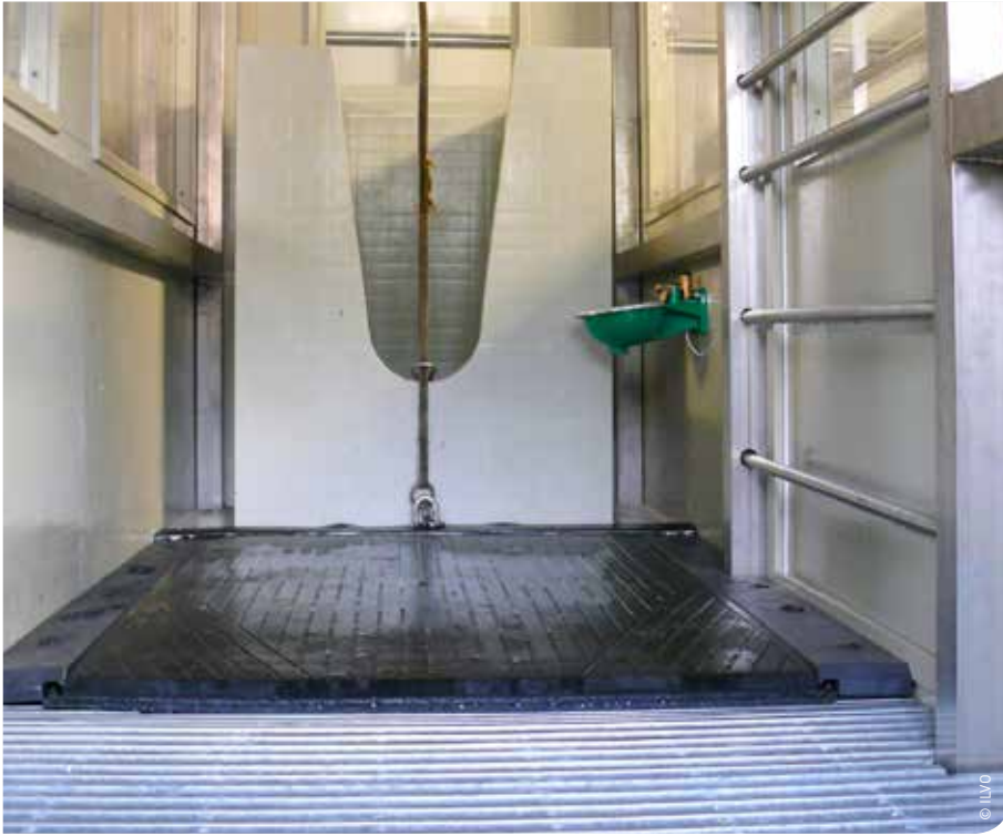
ILVO beschikt over 6 individuele gasuitwisselingskamers voor het meten van de CH 4 - en CO 2 -uitstoot.