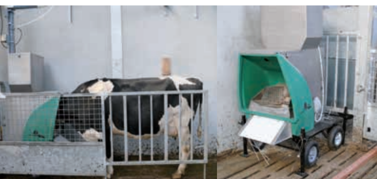
Foto 2: Nieuwe meettechnieken/meettoestellen maken het mogelijk om de CH 4 - en CO 2 -uitstoot te meten in praktijkomstandigheden en niet langer enkel onder proefomstandigheden. Deze krachtvoederautomaat (GreenFeed, C-Lock) meet de CH 4 - en CO 2 -uitstoot wanneer het dier de automaat bezoekt tijdens het verblijf in de loopstal of het bezoek aan de melkrobot. ILVO beschikt over twee zo'n GreenFeed-eenheden.