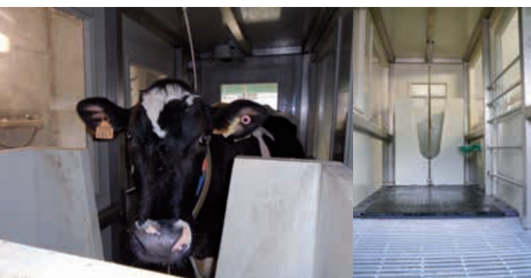
Foto 1: Om de effecten van methaanreducerende strategieën te meten maakt ILVO gebruik van individuele gasuitwisselingskamers (GUK), de gouden standaard van de CH 4 - en CO 2 -meettechnieken.

Daarnaast zijn er ook additieven of voedingssupplementen die de CH 4 -productie in de pens kunnen verminderen, door de microbiële populatie in de pens te wijzigen of een alternatief vormen voor het verwijderen van H 2 uit de pens. Herkauwers kunnen echter zonder de micro-organismen geen vezelrijke voeders verteren, volledige eliminatie van de pensflora is dus geen optie. Het is reeds bewezen dat het toevoegen van vetten aan het rantsoen, zoals bv. lijnzaadolie, de CH 4 -productie in de pens kan verminderen. Eén van de valkuilen is echter dat er kans is op extra CH 4 -productie in de mest en zo de winst die gemaakt werd door de lagere CH 4 -uitstoot in de pens teniet wordt gedaan. Niet enkel vetten komen in aanmerking om de CH 4 -productie in de pens te verlagen, andere types additieven met potentieel zijn plantenextracten (bv. essentiële oliën), secundaire plantmetabolieten (bv. saponinen), nitraten (bv. 3NOP), organische zuren en probiotica. De specifieke invloed die deze additieven hebben op de CH 4 -productie in de pens en/of in de mest kan afhankelijk zijn van het type basisrantsoen waaraan ze worden toegevoegd. Verder onderzoek is noodzakelijk. Een aantal managementbeslissingen kunnen er ook voor zorgen dat er minder methaan wordt uitgestoten per geproduceerde kg melk of kg vlees. Denk hierbij dan o.a. aan een verhoging van de voeder-efficiëntie, selectie op lagere methaanuitstoot en kortere tussenkalftijden.