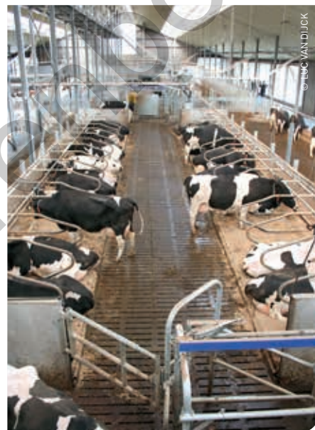
ILVO speelt een voortrekkersrol in het onderzoek naar emissiereducties.

"Het ILVO-onderzoek richt zich momenteel sterk op emissiereducties via het voeder en via inwerking op de vertering bij runderen", zegt Leen Vandaele. "Door sturing van het voeder en de voedermiddelen, maar ook van de micro-organis-