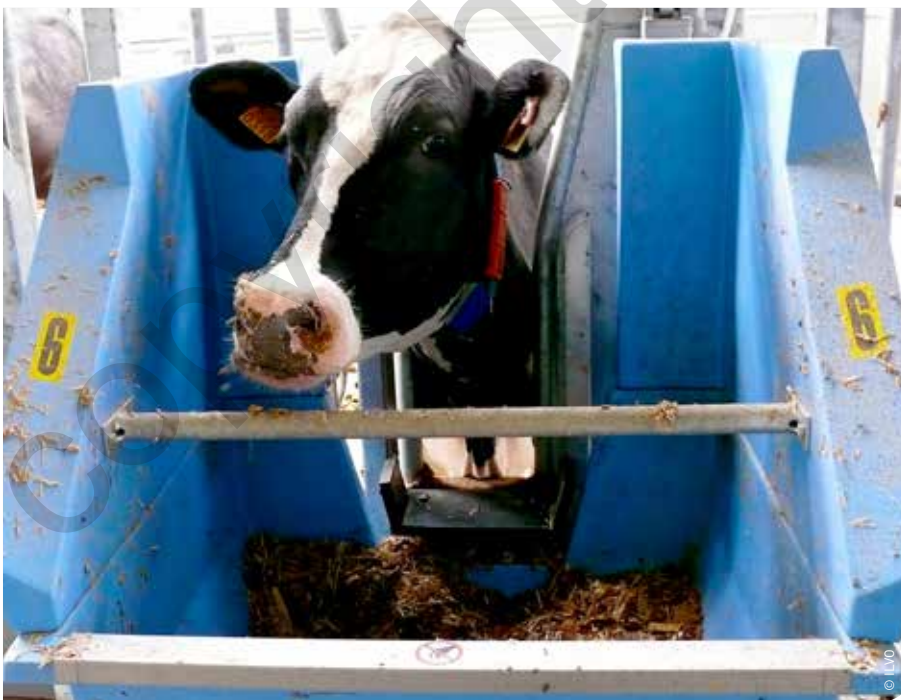
Sturen naar een lagere ammoniakemissie kan in beperkte mate via voedingsmaatregelen. Dankzij de 'roughage intake control'-ruwvoederbakken wordt op ILVO automatisch de dagelijkse ruwvoederopname van individuele dieren geregistreerd.

Ureum uitgescheiden via de urine wordt door urease, een microbieel enzym dat aanwezig is in de feces, omgezet naar ammoniak en \text{CO}_2 . Dit betekent dat, van zodra urine in aanraking komt met feces, ammoniak zal worden gevormd. Een deel van de gevormde ammoniak zal vervluchtigen. De mate van vervluchtiging is hoger bij een hoger stikstofgehalte, een hogere temperatuur en een hogere zuurtegraad in de mest, en bij een versterkte luchtcirculatie boven de mest. De